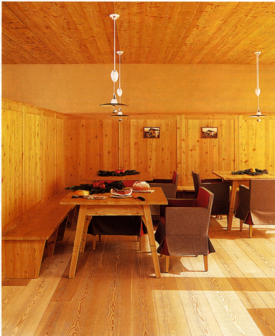
In der Stube wird Frühstück oder Brotzeit serviert. Die Stühle und Deckenleuchten stellen einheimische Handwerksbetriebe nach Thuns Entwürfen her (mehr Info im AD Plus). Rechts: Jedes Apartment hat eine kleine Küchenzeile mit Einbaugeräten von Neff.

Ultentaler Bauer hat die Trennwand aus Weiden geflochten. In der neu interpretierten Südtiroler Stube fallen die mit Loden bezogenen Sessel an den Holztischen sowie die an alte Küchenlampen erinnernden Emaill-Leuchten ins Auge. Über einen Innenhof gelangt man zu den Studios mit je 58 Quadratmeter Wohnfläche, jedes mit einer vierzig Quadratmeter großen Terrasse.